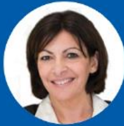
Anne Hidalgo Mayor of Paris (France)