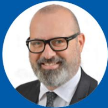
Stefano Bonaccini President of AICCRE, President of Emilia Romagna (Italy)