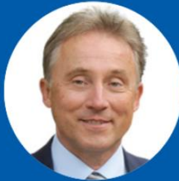
Rainer Haas President of Ludwigsburg County (Germany)