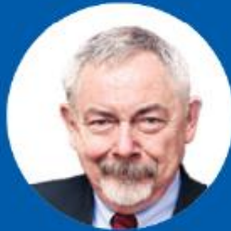
Jacek Majchrowski Mayor of Krakow (Poland)