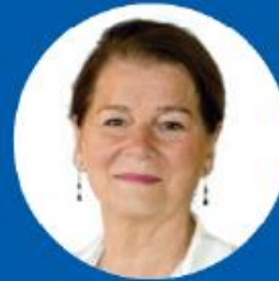
Annemarie Penn-Te Strake Mayor of Maastricht (Netherlands)