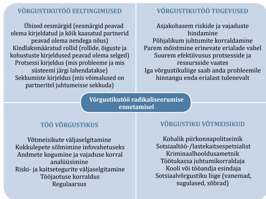
Joonis 2. Võrgustikutöö skeem radikaliseerumise ennetamiseks.

Võrgustikutööga on võimalik märgata riskikäitumist, sh radikaliseerumise ilminguid. Hästi toimiv võrgustik lihtsustab kõigi osaliste tööd. Erinevate osaliste teadmiste koondamine aitab varakult märgata riskifaktoreid, et hoida ära radikaliseerumist. Radikaliseerumise ennetamine võrgustikutöö kaudu eeldab, et kõik võrgustikus mõistavad ühtmoodi radikaliseerumise olemust ning info jagamise olulisust. Olles ise esimene riskikäitumise märkaja, peab võrgustiku liige olema valmis võtma vastutust ja initsiatiivi juhtumiga tegelda, kaasates olulisi võrgustikuliikmeid. Tuleb mõista, et varajase märkamise puhul on oluline olla ise koheselt info edastajaks ja mitte jääda ootama, et keegi teine probleemi märkab.